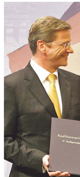
Вестервеле, Меркел и Зеехофер

щите две години. „Затова избрахме да тръгнем по този път, който залага изцяло на растеж и няма гаранция, че ще е успешен, но предлага шанс за това. При спестяване, спестяване, спестяване не виждам възможност да успеем“, заяви Меркел на партийния конгрес на Християндемократическия съюз (ХДС) в понеделник, ден след подписването на коалиционното споразумение с барварския Християнсоциален съюз (ХСС) на Хорст Зеехофер и на Партията на свободните демократи (ПДС) на Гидо Вестервеле. Както отбеляза консервативният Frankfurter Allgemeine Zeitung, стра-