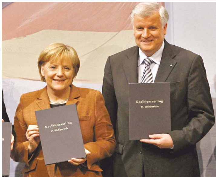
- имаме коалиционна сгелка